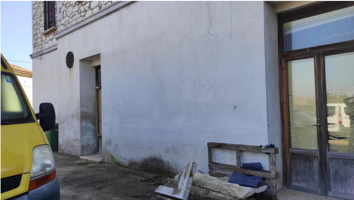
Hier soll eine Überdachung für den Handwerkunterricht gebaut werden.