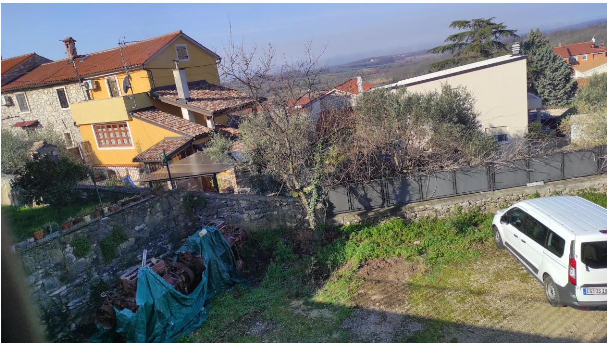
Hier soll ein Spielplatz mit Geräten entstehen.