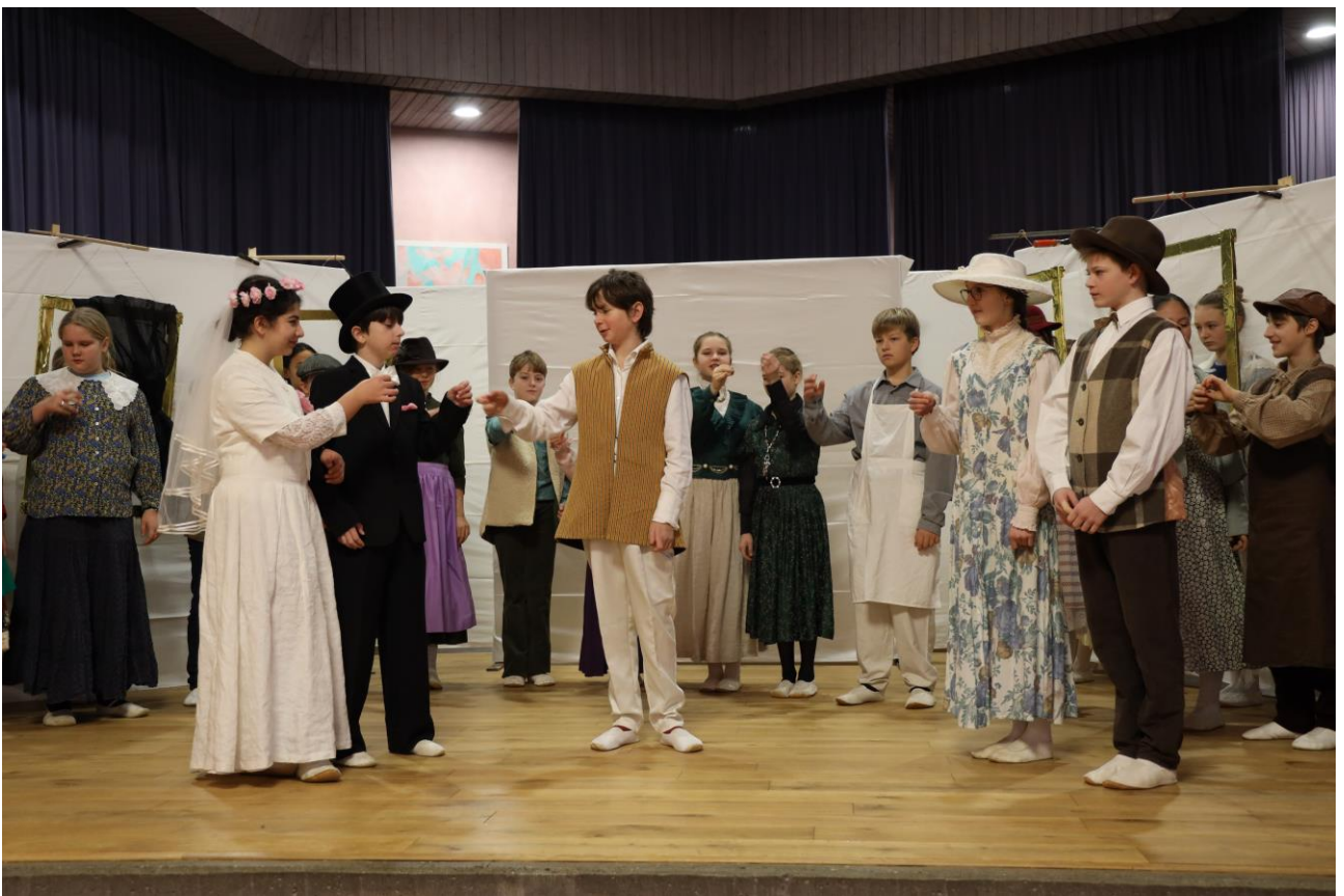
The Wedding at Ghostmoor Castle