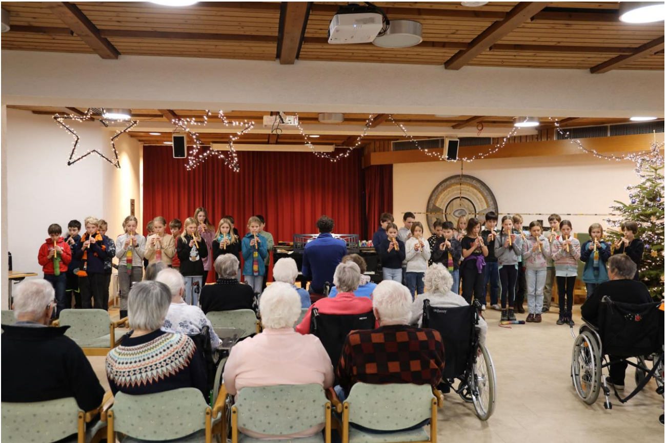
Weihnachtlicher Zauber im Dr.-Vöhringer-Heim