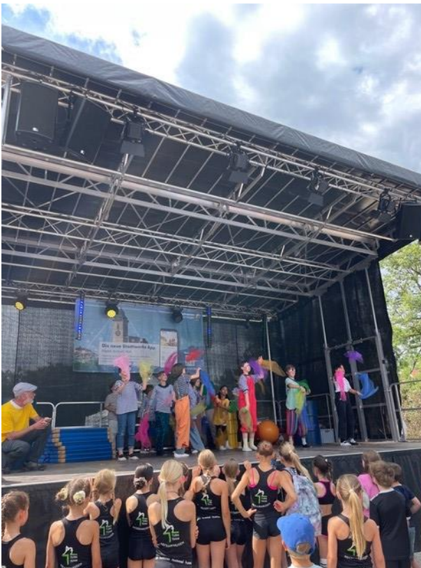
Buntes Treiben auf der Bühne am Stadtmuseum – die Künstlerinnen und Künstler zeigen ihr Können.