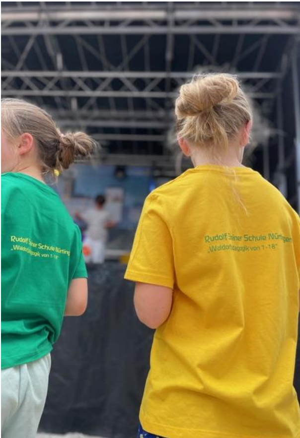
Schriftzug auf den T-Shirts – Wir repräsentierten unser Konzept „Waldorfpädagogik von 1 bis 18“.